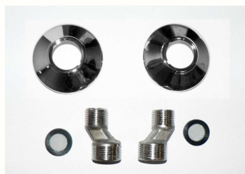
růžice, etážky a těsnění

Baterie je dodávána v roztečích 100 nebo 150mm.